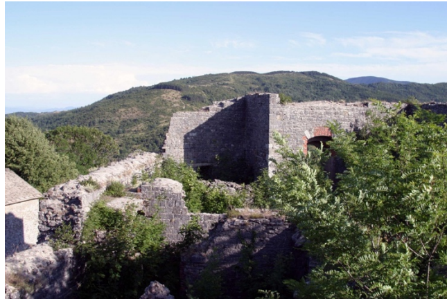
Forteresse de Chiusi Della Verna

☕ Déjeuner libre au village de Corezzo (Trattorias locales).