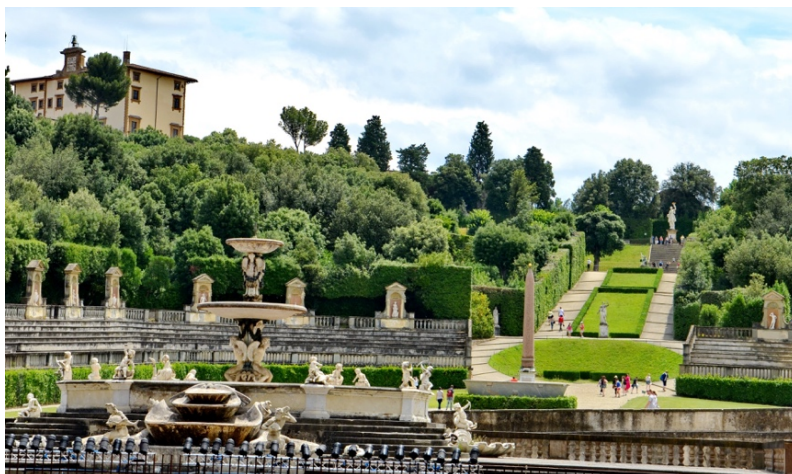
Jardin de Boboli