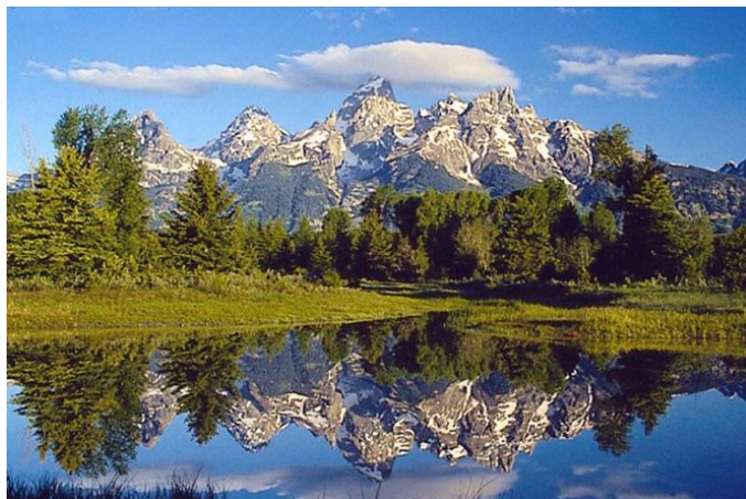
Parc national Appennino Tosco Emiliano