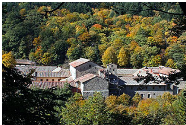
Ermitage de Camaldoli

🚌 15h - 15h30 Arrivée et visite de l'ermitage de Camaldoli et rencontre avec l'administrateur des réserves d'État et avec un représentant du Parc national, puis visite de la pépinière locale et rencontre avec l'Union des Communes du Casentino.