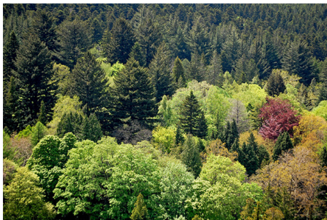
Arboretum de Vallombrosa

☕ Déjeuner libre à Vallombrosa ou Saltino