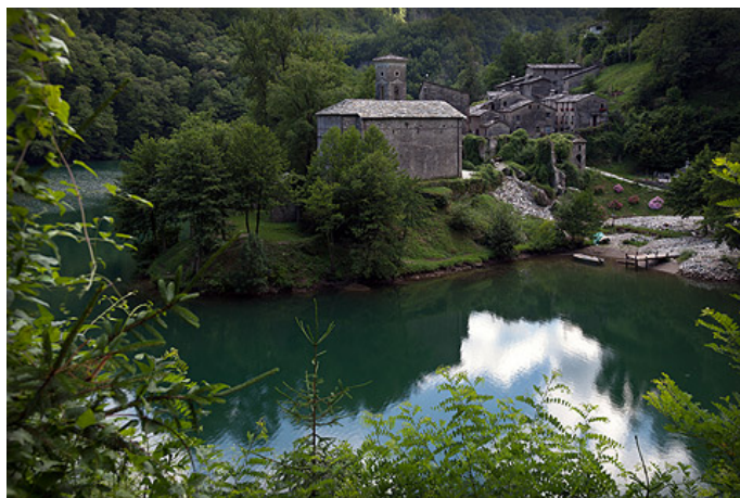
Vallée de la Garfagnana

Après-midi : San Romani in Garfagnana : visite de la centrale thermique à biomasse Camporgiono, visite d'une pépinière forestière et réunion avec l'Union des municipalités