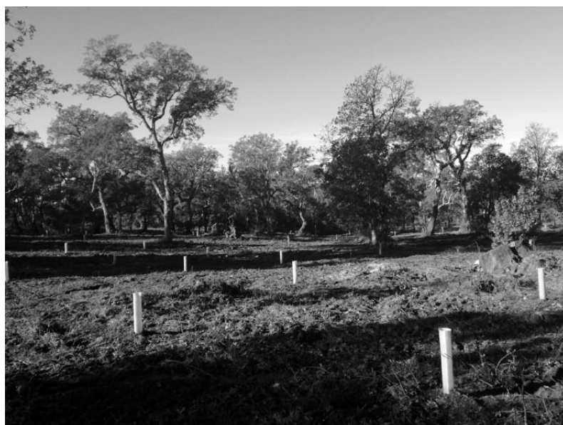
Photo 1 : Plantation de chêne-liège au Groupement forestier de la Fouquette.

B.P. : On va en tirer peut-être des conclusions hâtives mais on peut déjà dire que la clôture n'a pas marché à 100%. C'est très délicat d'entretenir une clôture électrique en forêt. Pourtant elle répondait à toutes les spécifications qui avaient été données par les fabricants et même les utilisateurs, puisque les sociétés de chasse ont l'habitude d'utiliser ce genre de chose. Néanmoins elles ont lâché à plusieurs reprises, on a eu du mal à les remettre en place à chaque fois. Mais, heureusement, pour ce qui est des sangliers qui ont franchi les clôtures, ils ne l'ont pas fait immédiatement après la plantation. Si bien que les dégâts qu'on a pu observer, ce ne sont pas des dégâts énormes comme des zones entièrement soulevées et labourées quand ils cherchent de la nourriture dans la première épaisseur du sol. Donc on peut penser que, malgré le fait que les clôtures n'aient pas été