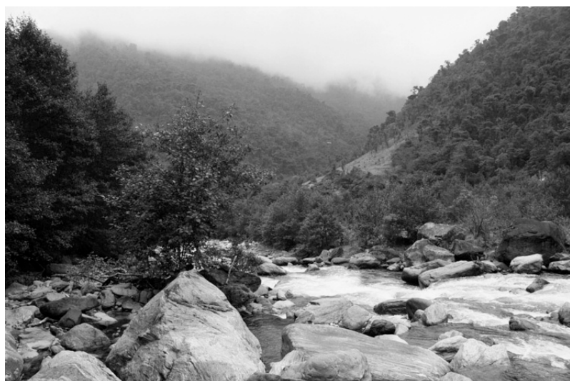
Photo 1 : Bassin versant forestier dans les Andes équatoriennes.

– l'époque de l'année : dans les régions soumises à un régime de mousson, par exemple, davantage d'eau s'infiltré dans le sol au début de la saison des pluies qu'à la fin, quand les sols sont gorgés d'eau et la nappe aquifère est proche de la surface du sol ;