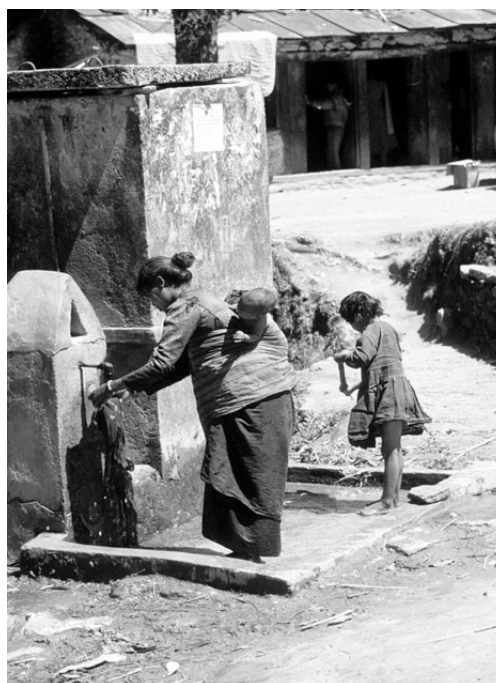
Photo 2 : Eau potable dans un village du Népal provenant d'une nappe aquifère forestière.

Les sols forestiers fonctionnent comme des éponges et retiennent l'eau bien plus longtemps que ceux qui sont soumis à d'autres usages. La déforestation augmente donc les risques de débordement et d'inondation en saison des pluies, tout comme elle entraîne des risques de sécheresse en saison sèche. Déforestation et reboisement ont de ce fait des effets opposés sur la quantité d'eau disponible. Il faut toutefois remarquer que le rôle des forêts et des arbres dans la régulation des inondations et des sécheresses prolongées est une affaire d'échelle : les forêts peuvent réduire les pics d'inondations et les surfaces concernées à petite échelle d'espace, sur de courtes périodes et à l'occasion d'événements pluvieux modérés. Mais l'étendue d'inondations de grande ampleur survenant dans la partie aval des bassins versants ne semble pas être liée au degré de couverture forestière ni aux méthodes de gestion sylvi-