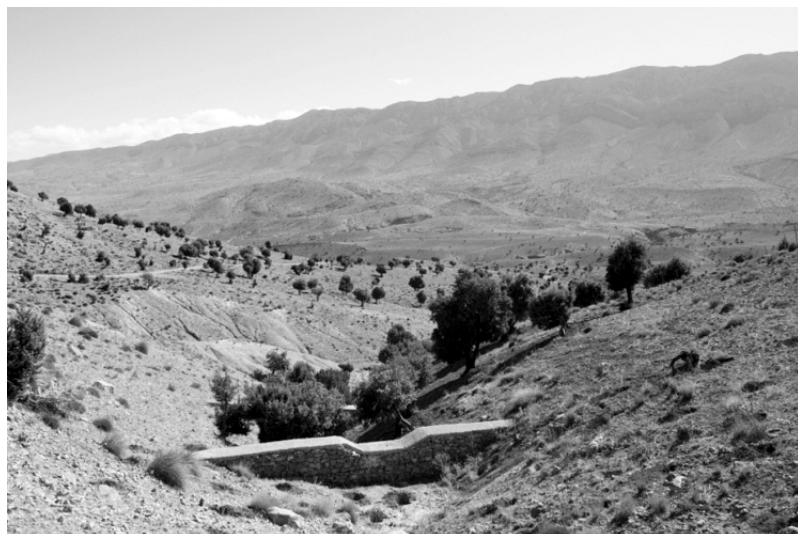
Photo 3 : Arbres isolés et cours d'eau asséché dans le Haut-Atlas au Maroc.

violentes. C'est pourquoi, les compromis entre utilisation de l'eau par les arbres et production de services environnementaux doivent être soigneusement évalués dans les projets d'aménagement et prises de décision. Si l'objectif de gestion d'un espace forestier est d'augmenter l'approvisionnement en eau en supprimant des arbres, les effets potentiellement négatifs d'une telle opération sur la qualité de l'eau, les risques de déstabilisation des sols et d'érosion de la biodiversité doivent être soigneusement pris en considération.