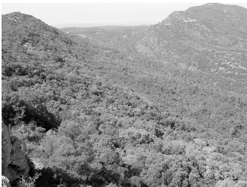
Photo 1 : Vue sur la chênaie verte depuis le Concors

Autres espèces caractéristiques, les oiseaux cavicoles (qui vivent dans les trous