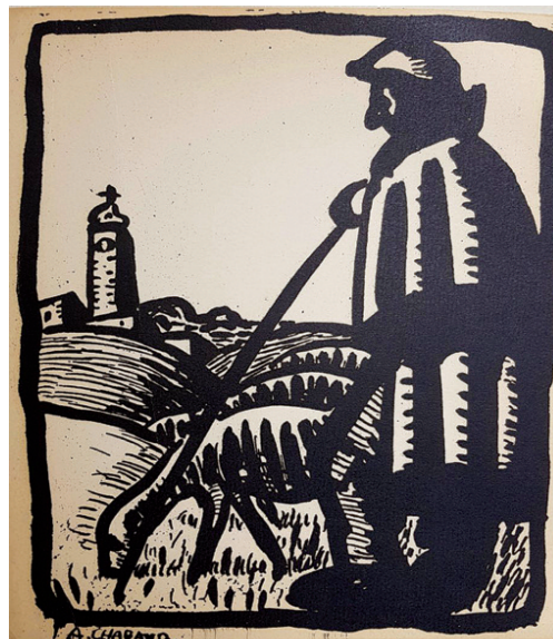
Illustration Le berger de A. Chabaud.

5 - Virgile, Les Géorgiques , Garnier Flammarion. 6 - La Bruyère, Les caractères , Gallica Les essentiels Litterature.