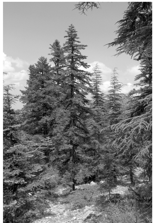
Photos 5 et 6 : Abies marocana