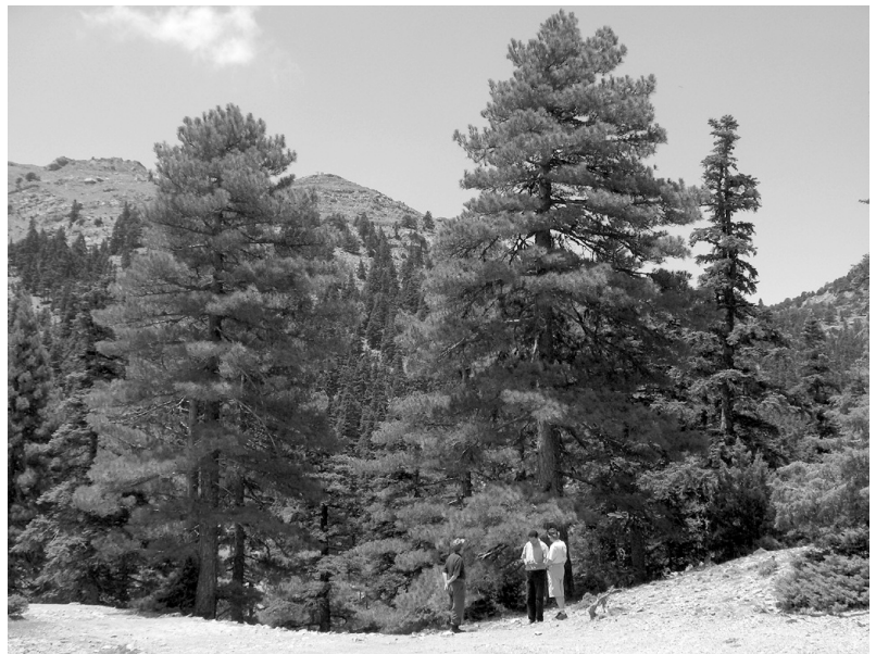
Photo 4 (en haut) : Paysage forestier du Parc

La régénération assistée d' Abies marocana se fait par parcelles de 150 ha clôturées : plu-