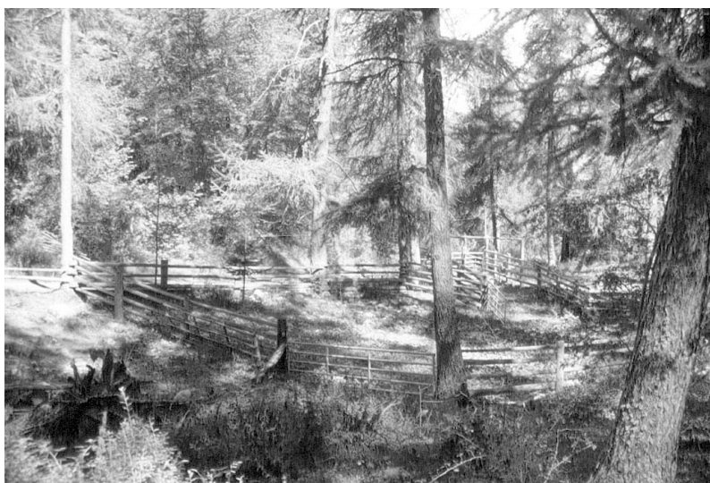
Photo 1 : Parc de contention et de tri des animaux au pied du pâturage

D'autre part, les observations annuelles ont mis en évidence des facteurs discriminants, tels que le recouvrement arbustif et la pente, pour les potentialités d'exploitation par les animaux.