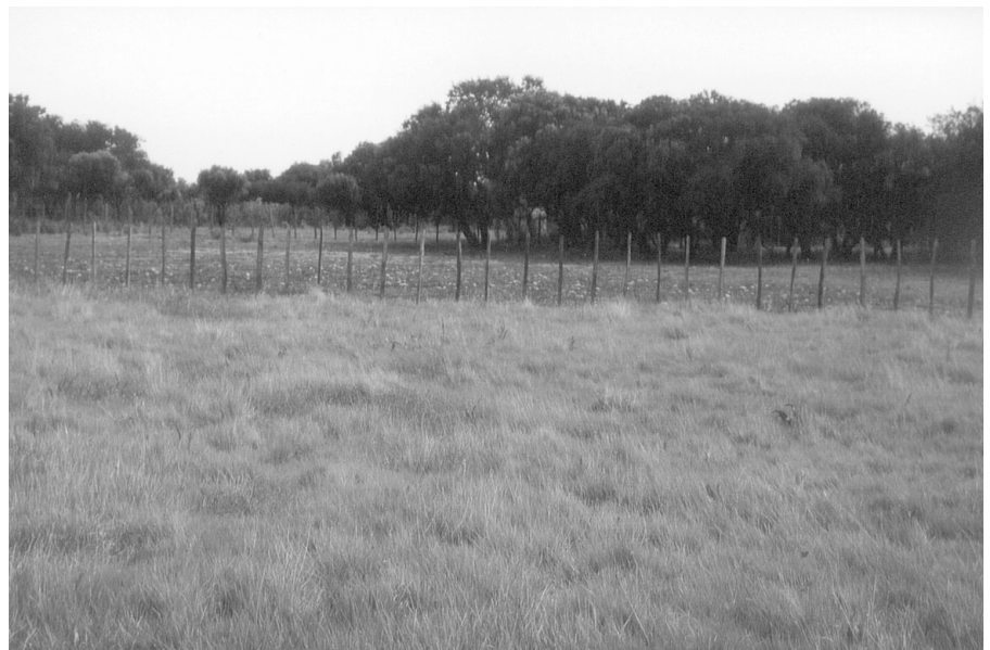
Photo 1 : Acquis par le CEEP, ce site abrite la seule station mondiale d'une petite germandrée, le teucrium de Crau

rain sur la commune de Mérindol dans le Vaucluse qui abrite la dernière station française connue de Garidelle fausse nigelle, une petite plante messicole ; acheté par le CEEP sur une indication du Conservatoire botanique de