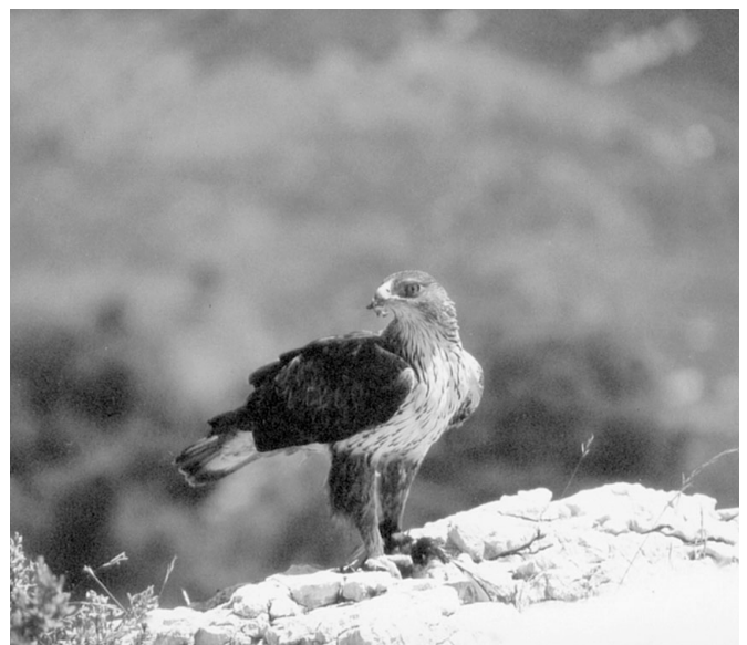
Photo 3 : Les 12 derniers couples d'Aigle de Bonelli dans la région font l'objet d'une attention particulière. Le réseau de bénévoles du CEEP surveille les reproductions et tente d'enrayer sa disparition