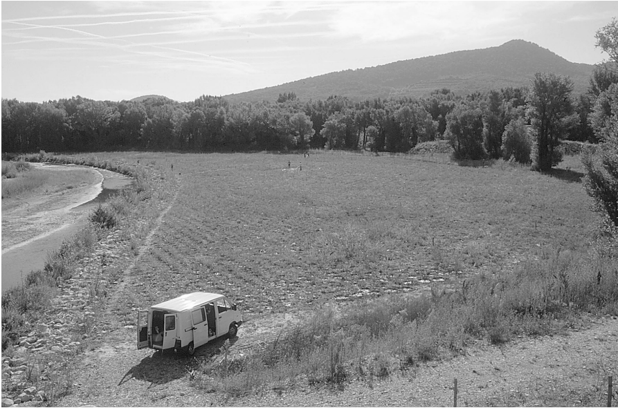
Photo 2 : Essai de reconstitution de ripisylve après remblaiement d'une anse d'érosion, à Roaix sur l'Ouvèze.