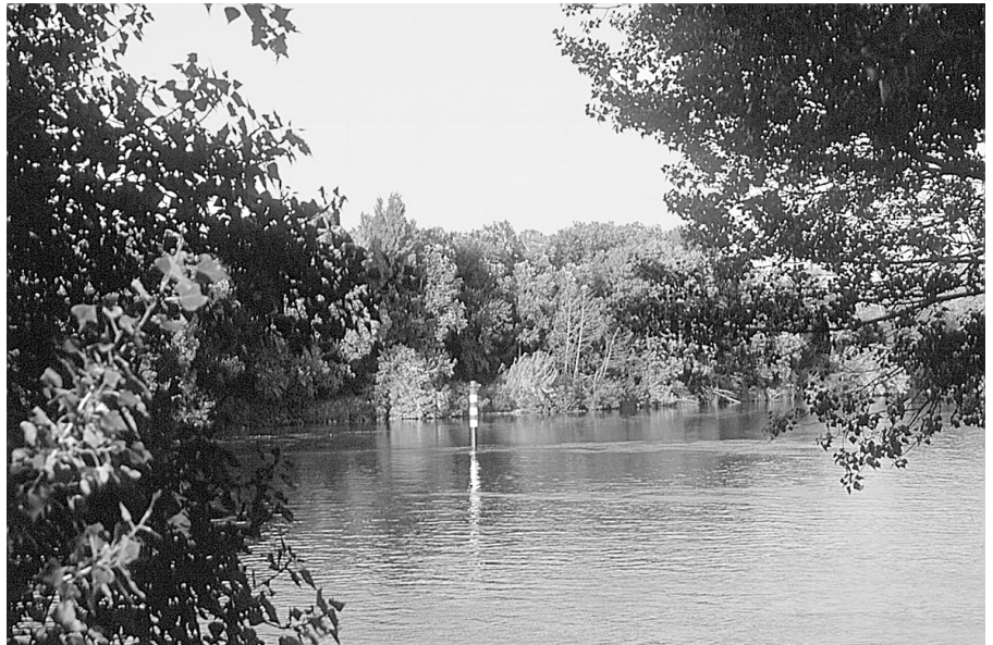
Photo 3 : Ripisylve d'un bras mort du Rhône, le Rovestidou à Caderousse

Ce projet, dont la réalisation vient de commencer, a pour ambition de mettre à la disposition de tous ceux qui veulent reconstituer des ripisylves tous les moyens nécessaires pour y parvenir dans les meilleures conditions.