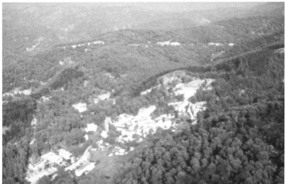
Photo 1 : Le feu de l'Etoile au nord de Marseille, on peut remarquer les sautes de feu.