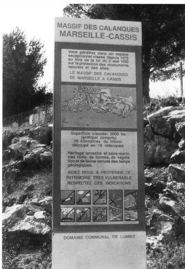
Photo 1 : Panneau d'information sur les Calanques au départ de Luminy.

Il reste aussi que sur la côte rocheuse calcaire du littoral méditerranéen, les Calanques sont le seul endroit