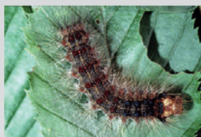
Chenille de bombyx de 5 à 7 cm.

– La Tordeuse verte du Chêne ( Tortrix viridana ), observée de façon importante en Corse. Cette chenille est un défoliateur précoce de tous les chênes ce qui signifie qu'elle attaque les arbres dès leur débourrement. Elle consomme les bourgeons (en période de pullulation), les feuilles et les bourgeons floraux (créant des problèmes de régénération). Par son caractère précoce, les chênes refont facilement une deuxième feuillaison en mai-juin. La lutte contre cette chenille est donc rarement utile mais possible avec la bactérie Bacillus thuringiensis (Bt) sur les jeunes plantations, les peuplements dépérissant et les porte-graines.