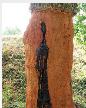
Plaie par laquelle suinte une exsudation brunâtre due au charbon de la mère.

Les pathogènes autres qu'entomologiques sont rares sur le réseau de placettes avec seulement 2 % des signalements. A noter toutefois les deux suivants, assez fréquents dans le Var :