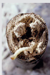
Larve de Bupreste.

Une régulation naturelle se fait par la famine, la canicule et le développement rapide de ses prédateurs, notamment le coléoptère Calosome. La lutte au Bt est possible sur les premiers stades larvaires seulement et n'est préconisée que dans certains cas (jeunes plantations, zones urbanisées).