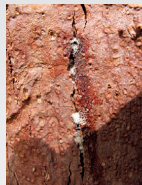
Sciure blanche, trous d'entrée et adultes de Platype (7 à 8 mm).

Un test dit « élixa » permet une détection aisée sur le terrain. La seule lutte possible est préventive pour éviter la dissémination du champignon : bien nettoyer les outils, éviter le compactage des sols.