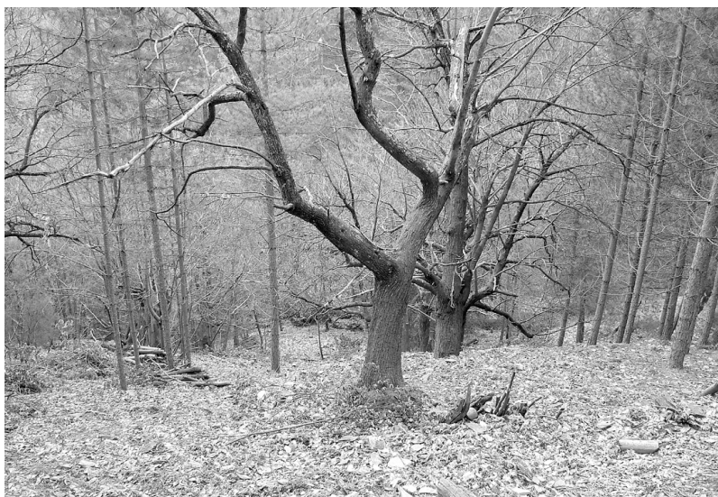
Photo 6 : Ancien verger de châtaigniers avant rénovation