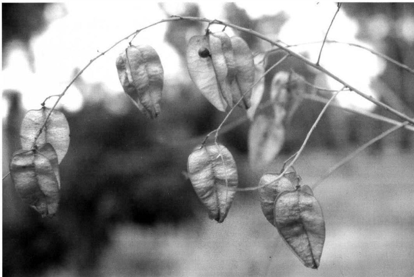
Photo 3 : Koeulreteria paniculata , Savonnier - Arboretum du Centre héliomarin