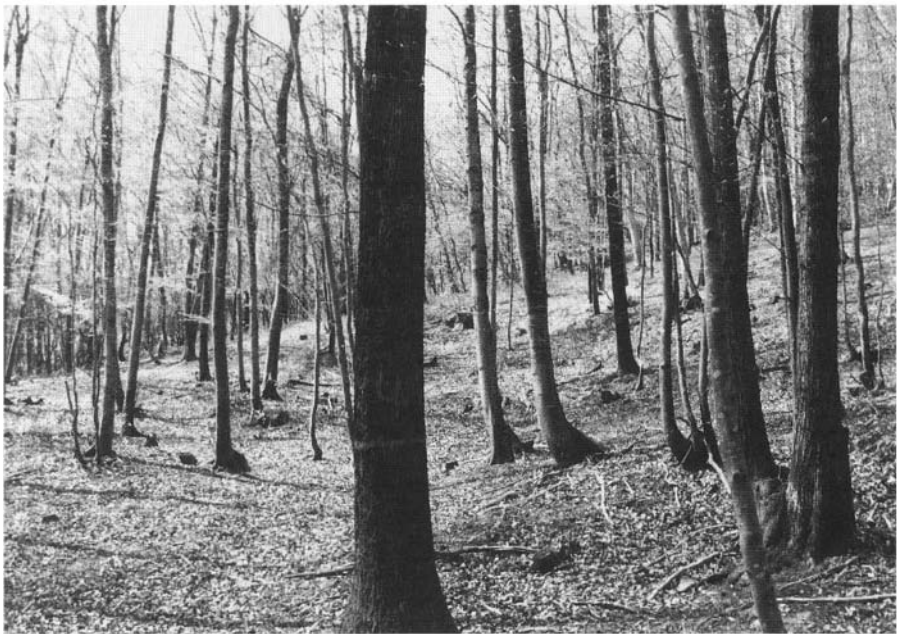
Photo 1 : Placette de référence montrant, 9 ans après, le résultat d’une opération de balivage réalisée sur un taillis de hêtre et chêne rouvre dans le Razès (Aude). Autour de la placette, aucune intervention n’a été effectuée.