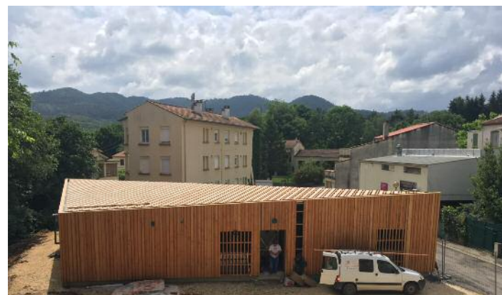
Photo : Vue de la structure bois de la maison des professionnels de santé de Cendras.

Le bois a été utilisé en ossature, en charpente (en pin maritime, pour moitié issu de la forêt communale) et en bardage (douglas, issu de forêts du Massif Central). Sur les 313 m 3 de pin maritime coupés en forêt communale, après tri des bois, 44 m 3 ont servi à la construction du bâtiment (soit environ 14% de la coupe, avant sciage). A noter que cette partie de forêt n'avait jamais été gérée, ce qui correspond malheureusement à une majorité des forêts cévenoles. Le reste des bois de la coupe a été valorisé en bois-énergie, pour la chaufferie communale, et en bois-industrie, pour de la pâte à papier. Le lot de bois a été complété par l'achat d'autres pins maritimes dans une com-