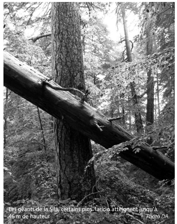
Les géants de la Sila, certains pins laricio atteignent jusqu'à 46 m de hauteur

Nous avons la chance de visiter une scierie, installée au cœur d'une magnifique forêt privée à 850 m d'altitude. La scierie exploite une hêtraie sapinière divisée en trois massifs distincts de 800, 400 et 300 hectares, soit environ 10 000 m 3 de sciages par an. C'est tout juste suffisant pour maintenir les emplois des 35 familles qui y travaillent, d'autant que la conjoncture