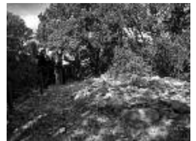
Photo : Les adhérents devant les vestiges archéologiques du Domaine de Roussières.

tion avec l'ensemble des partenaires techniques et institutionnels concernés, cette réflexion pourrait prendre la forme de journées sur le terrain, organisées dans différents départements de la façade méditerranéenne. Des publics variés, non seule-