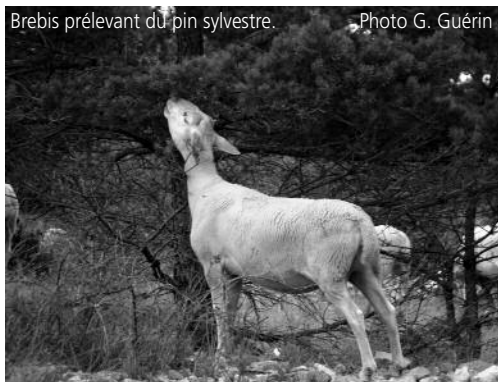
Brebis prélevant du pin sylvestre.

* CASDAR : Compte d'affectation spéciale pour le développement agricole et rural