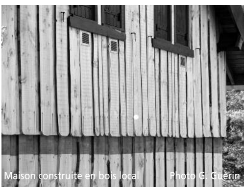
Maison construite en bois local.