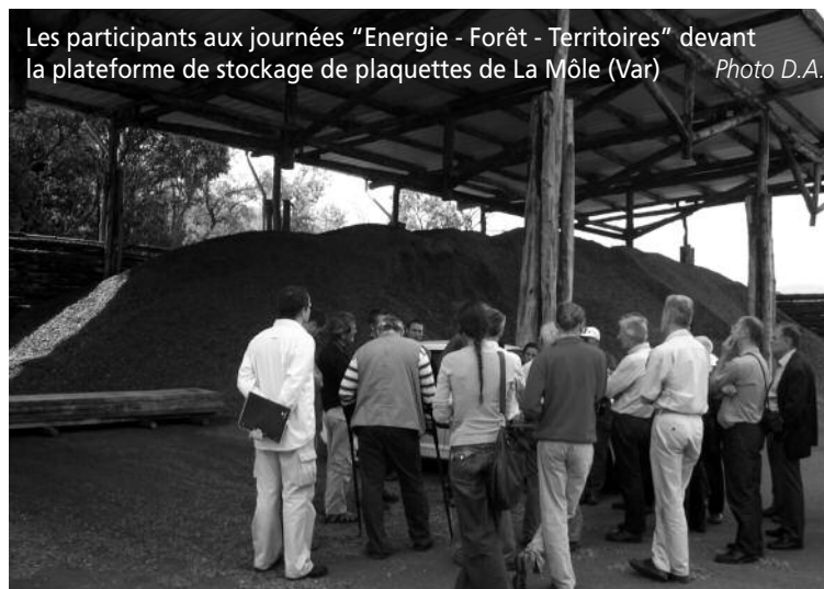
Les participants aux journées "Energie - Forêt - Territoires" devant la plateforme de stockage de plaquettes de La Môle (Var)